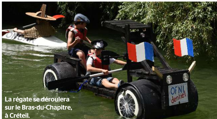
La régata se déroulera sur le Bras-du-Chapitre, à Créteil.